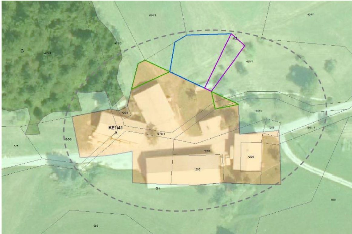
Slika 5: Preoblikovanje in povečanje stavbnih površin posamične poselitve v podEUP KE1/41 v občini Dobrova – Polhov Gradec (modri poligon = povečanje stavbnega zemljišča; zeleni poligon = preoblikovanje-izvzem stavbnega zemljišča; vijolični poligon = preoblikovanje-povečanje stavbnega zemljišča; siva prekinjena črta = domačija v gruči).

Grafični prikaz sprememb iz elaborata lokacijske preveritve za območje posamične poselitve v podEUP KE1/41 v občini Dobrova – Polhov Gradec, št. 04/2021, izdelal STUDIO FORMIKA prostorsko in arhitekturno načrtovanje, d. o. o., Cerknica, junij 2021, dop. avgust 2022: